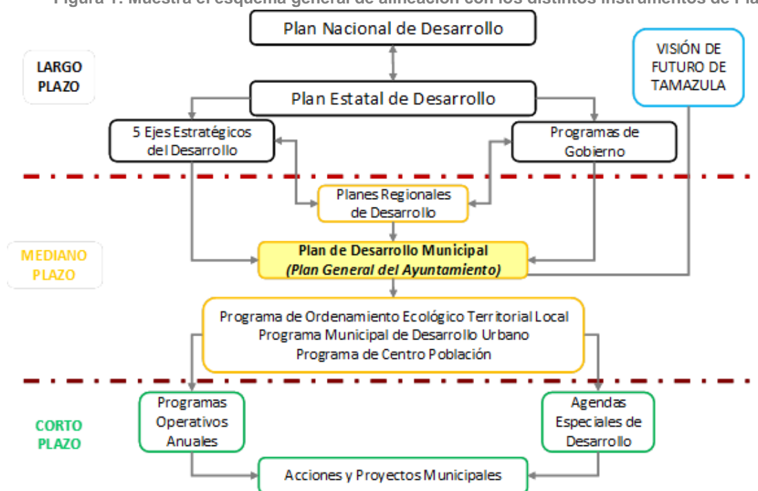
Figura 1: Muestra el esquema general de alineación con los distintos instrumentos de Planeación.