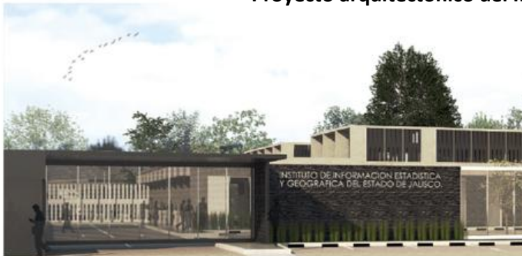
El Proyecto a detalle.