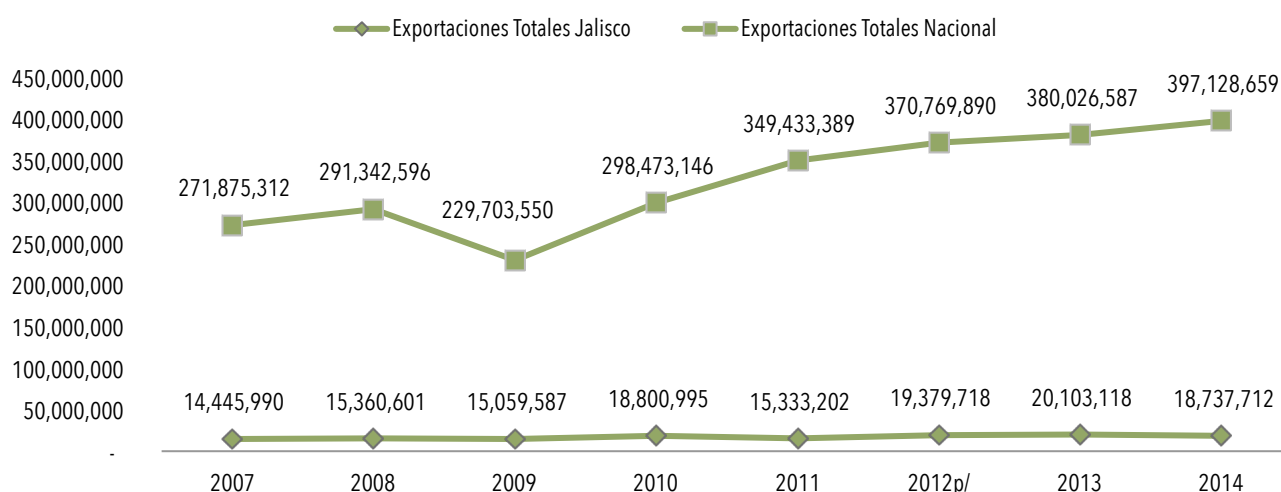
Gráfico 3. Exportaciones totales de mercancías a nivel nacional y Jalisco para el periodo 2007-2014, miles de dólares corrientes

Fuente: INEGI, 2016. Exportaciones por entidad federativa, recuperado el 11 de julio del 2016 de http://www.inegi.org.mx/est/contenidos/proyectos/registros/economicas/exporta_ef/default.aspx