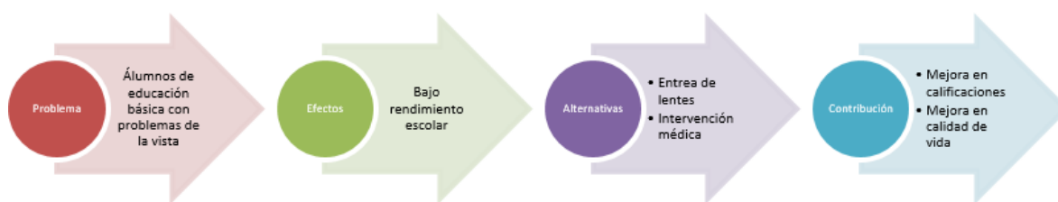
Figura 1. Lógica de intervención del programa.

Su lógica de intervención detectada en la MIR 2016, ROP 2017, Árbol de Problemas , Árbol de Objetivos y tras las entrevistas realizadas se expresa gráficamente de la siguiente manera: