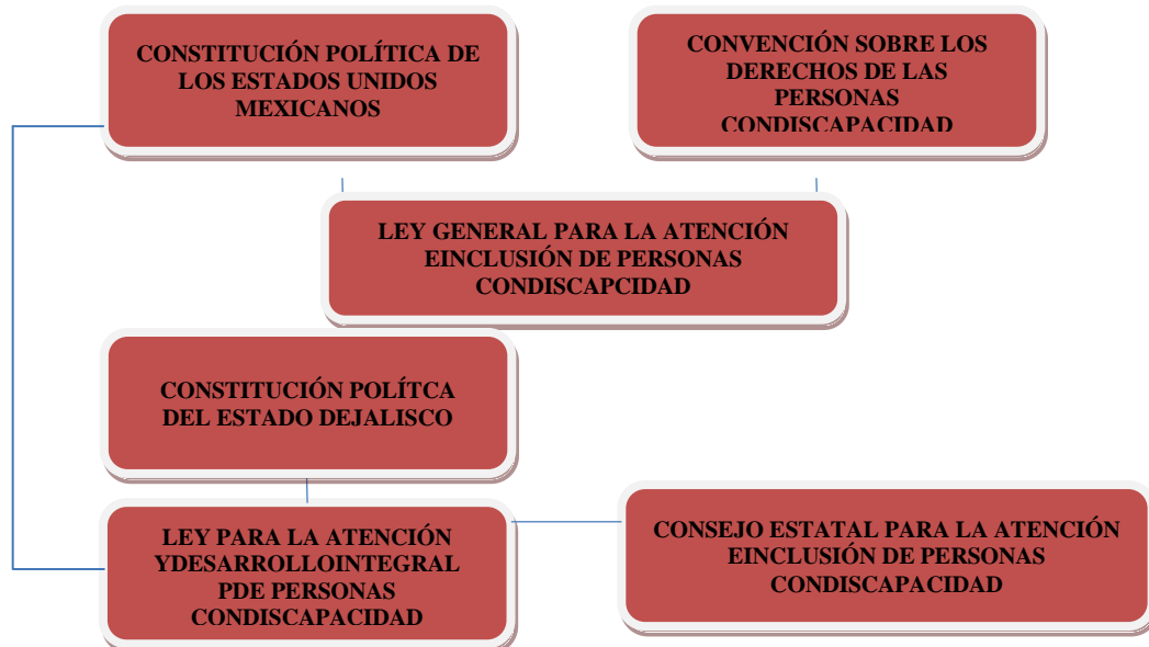
Figura 1.1 Diagrama del marco normativo del COEDIS Jalisco.

La Ley antes citada dio origen al Consejo Estatal para la Atención e Inclusión de Personas con Discapacidad (COEDIS Jalisco).