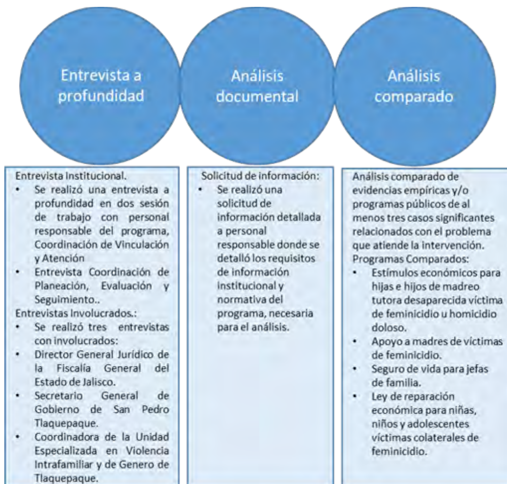
Figura 1 Técnicas de investigación empleadas. 5