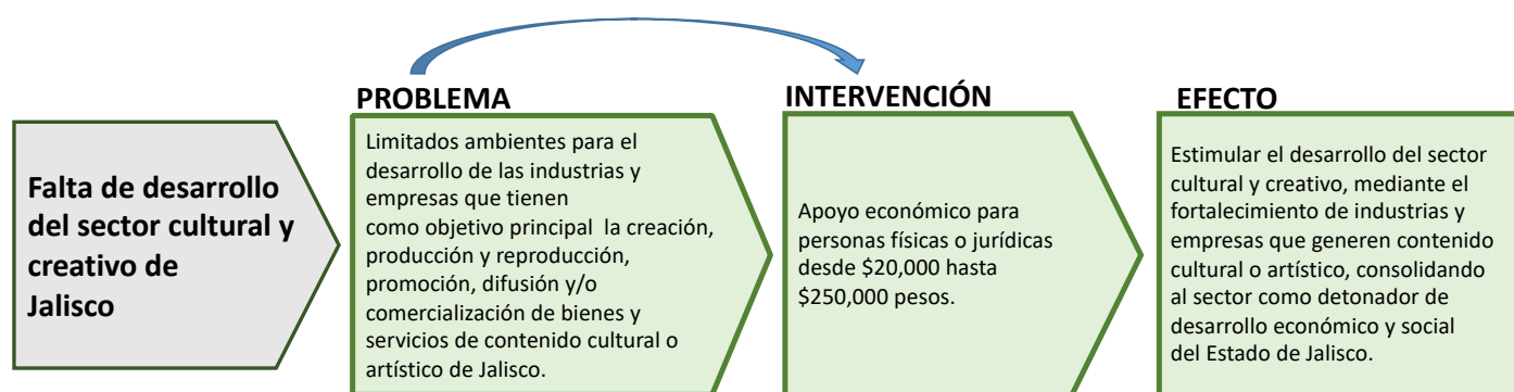
Figura 2.Lógica de la Intervención 6

En las ROP del Programa Proyecto Industrias Culturales y Creativas se aprecia sustento desde las posturas de la teoría del cambio, ya que se menciona explícitamente el tránsito de un contexto en el que existen limitados ambientes para el desarrollo de industrias y empresas culturales, a uno en el que existen dichas condiciones para contribuir al desarrollo social y económico de la región. Asimismo, se aprecia una conexión lógica entre la problemática detectada y la solución planteada.