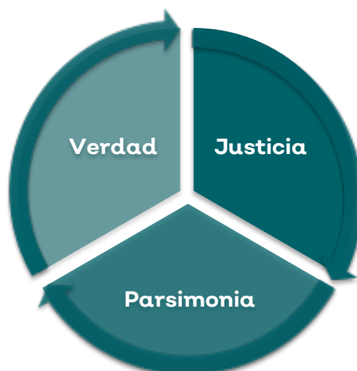
Dimensiones de los Valores