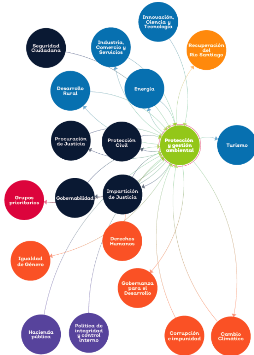
Figura 5. Mapa sistémico temática Protección y gestión ambiental