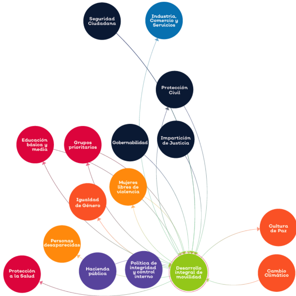
Figura 4. Mapa sistémico temática Desarrollo integral de la movilidad