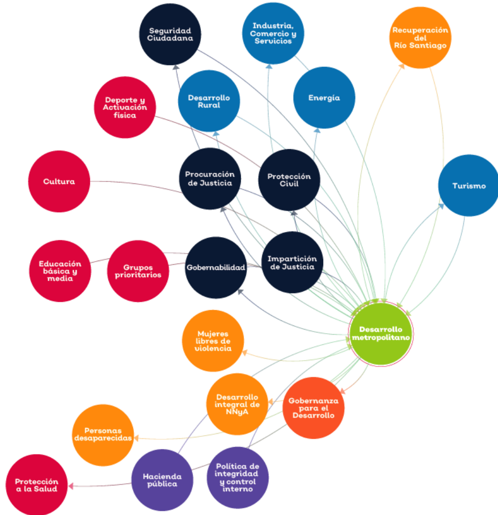
Figura 1. Mapa sistémico temática Desarrollo Metropolitano