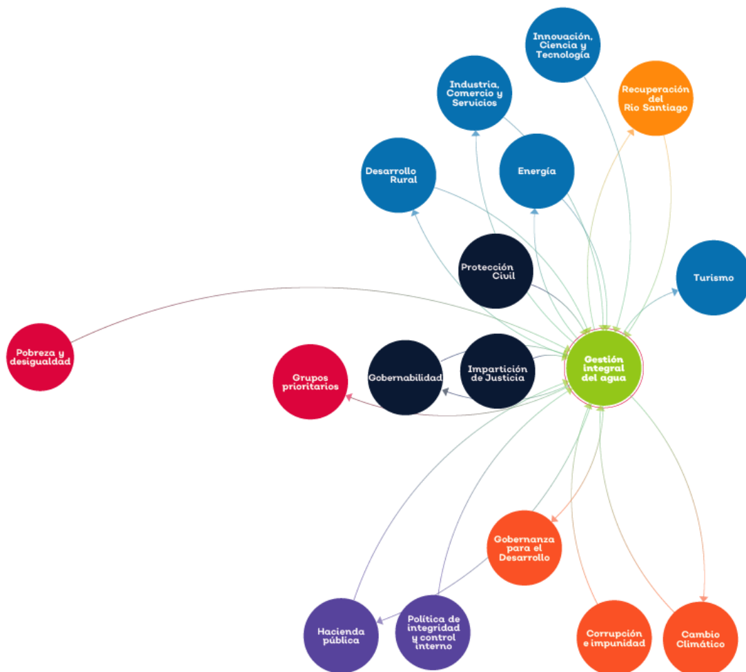
Figura 2. Mapa sistémico temática Gestión integral del agua