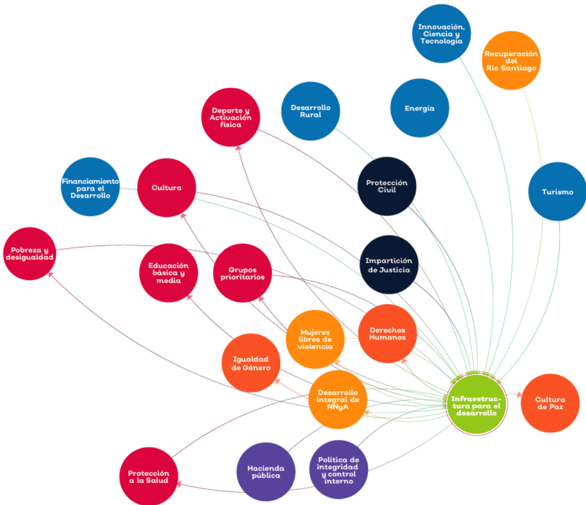
Figura 3. Mapa sistémico temática Infraestructura para el desarrollo