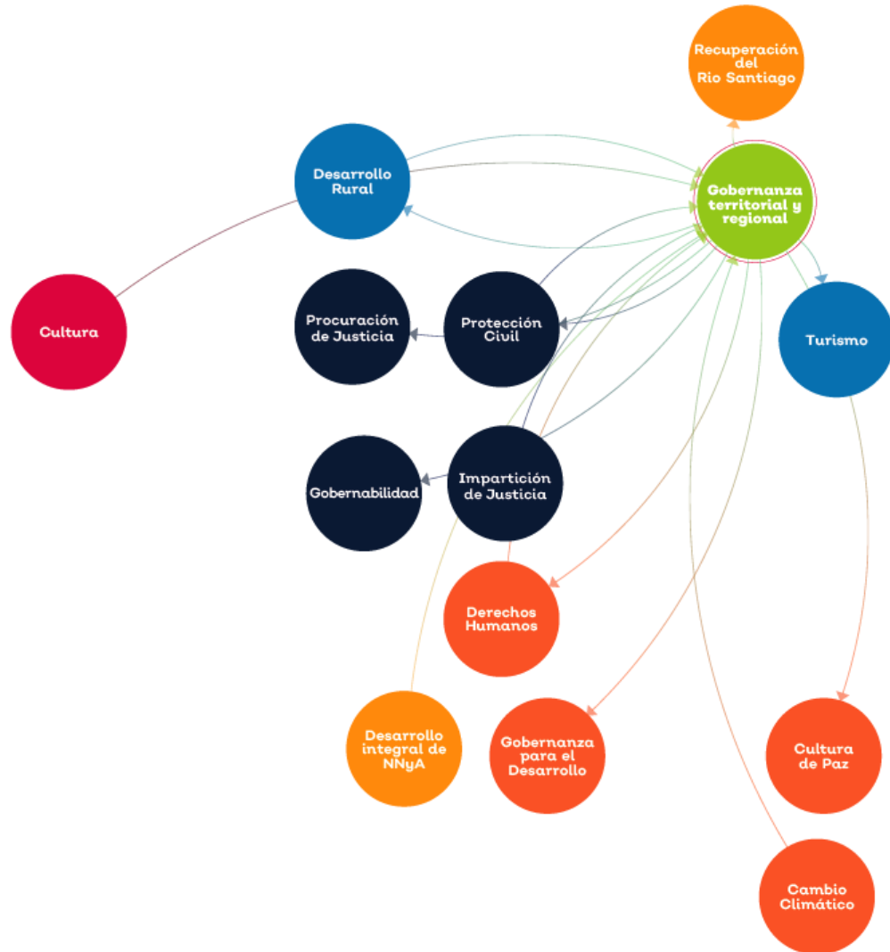
Figura 7. Mapa sistémico temática Gobernanza territorial y regional