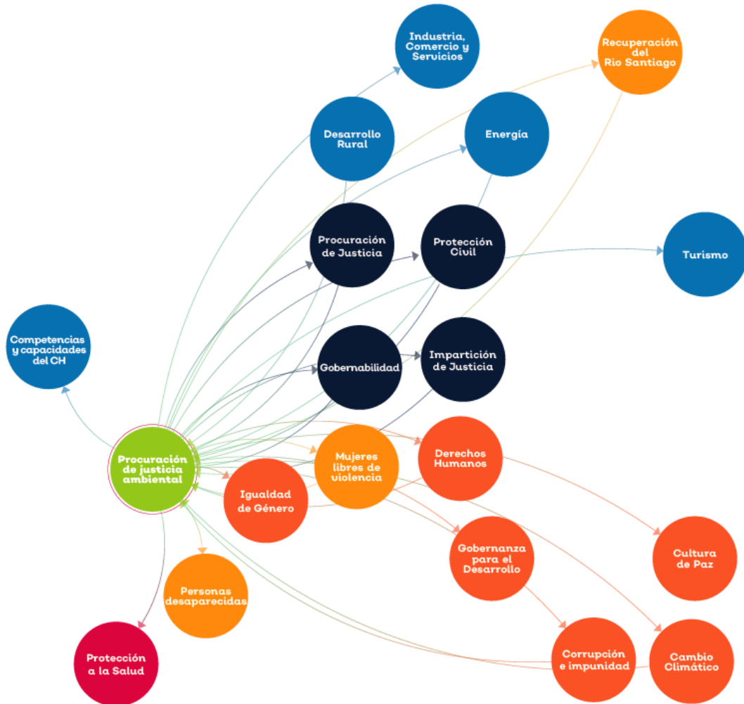
Figura 8. Mapa sistémico temática Procuración de justicia ambiental