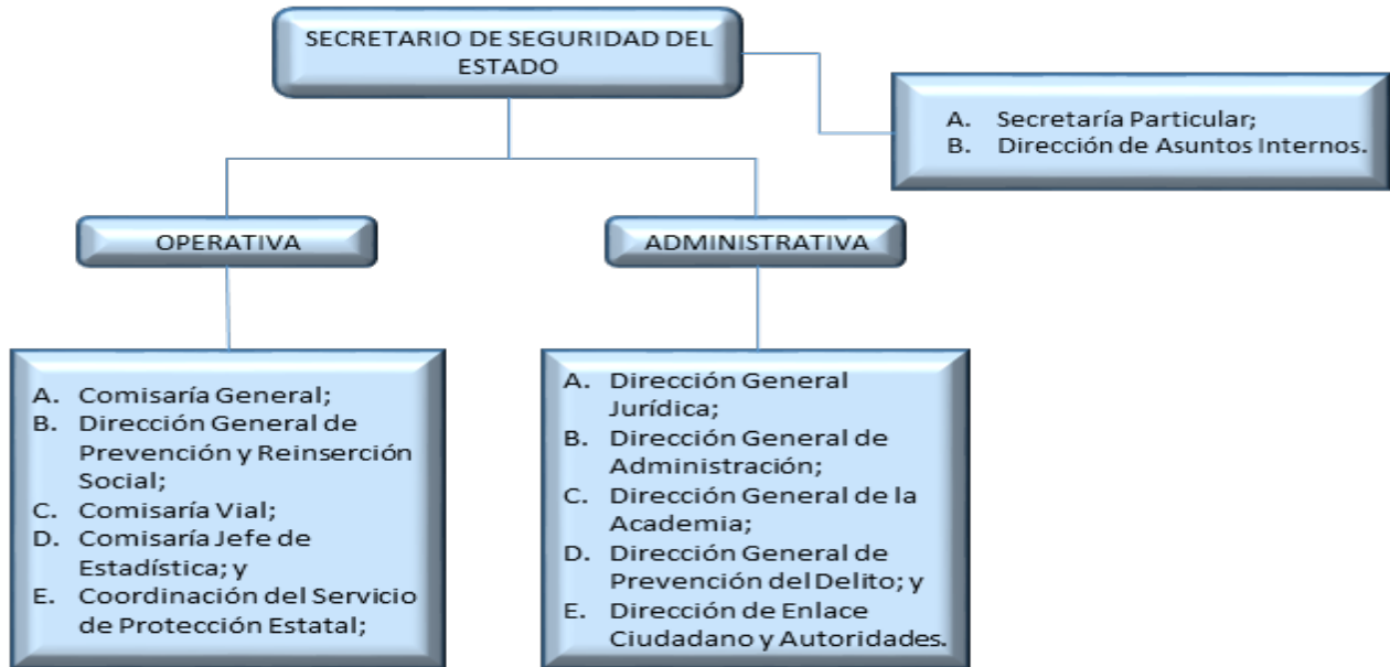
Figura 2. Organigrama