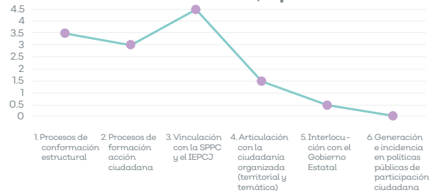
Línea base CEPC Jalisco, septiembre 2022