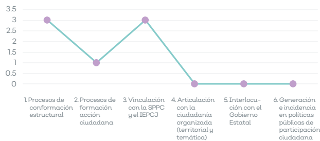
Línea base CEPC Jalisco, mayo 2021