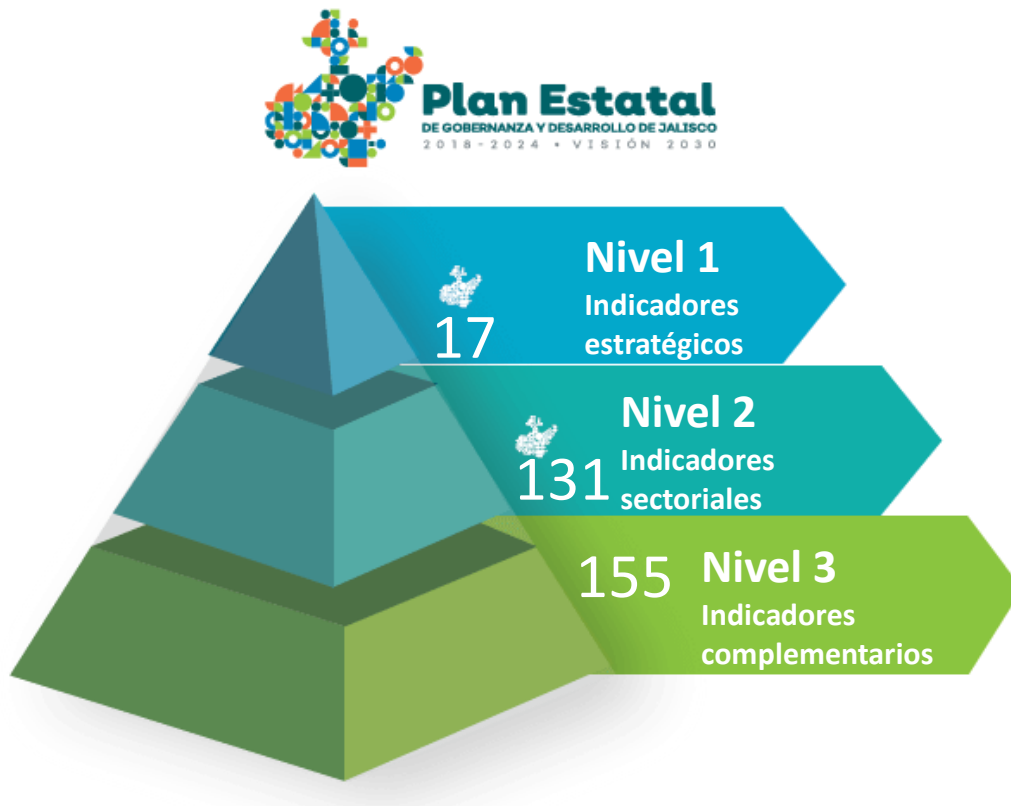
Ilustración 3. Indicadores de MIDE Jalisco por nivel

Los instrumentos derivados del Plan Estatal deberán definir los indicadores de MIDE Jalisco que estarán vinculados a los objetivos específicos del instrumento de planeación (ver https://seplan.app.jalisco.gob.mx/mide/panelCiudadano/inicio ), estableciendo su alineación a estrategias del instrumento.