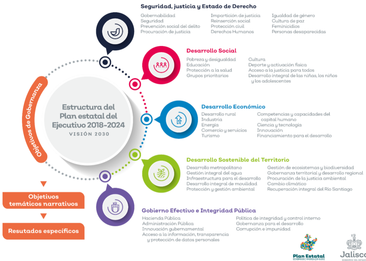
Ilustración 2. Estructura general del Plan Estatal

El Plan Estatal está alineado al Plan Nacional de Desarrollo (PND) y a los Objetivos de Desarrollo Sostenible (ODS) de la Agenda 2030 a través de sus 46 temáticas. Los instrumentos de planeación derivados del Plan Estatal deberán situarse también a partir de estos importantes mecanismos de planeación y coordinación. En el Anexo 4 se desglosan las 169 metas de los 17 Objetivos de Desarrollo Sostenible.