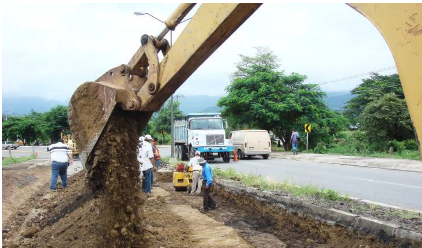
Rehabilitación de entronque carretero a la cabecera municipal