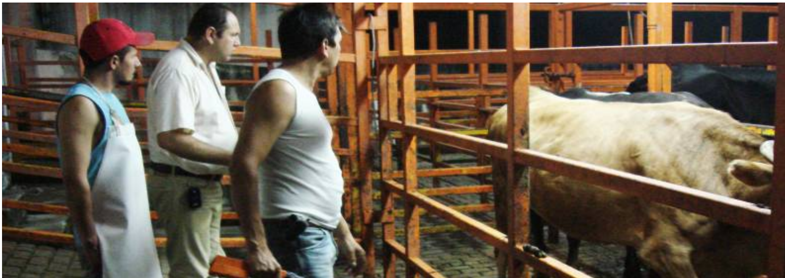
Foto galería en el portal www.casimirocastillo.gob.mx/galeriainforme2010