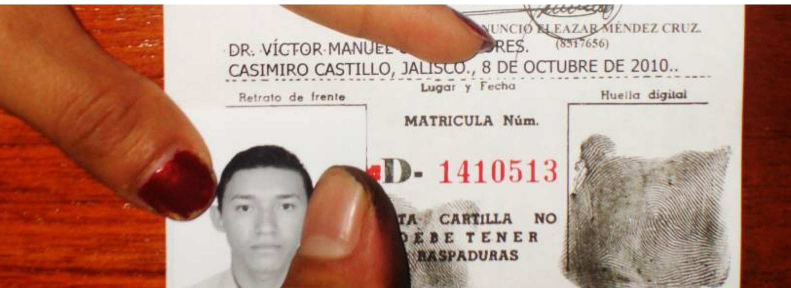
Firma de Cartilla del Servicio Militar Nacional

De igual manera el Encargado de la organización de la Junta Municipal de Reclutamiento, emite el siguiente informe de efectivos del Servicio Militar Nacional alistados, correspondiente a los meses de Enero a Octubre de 2010.