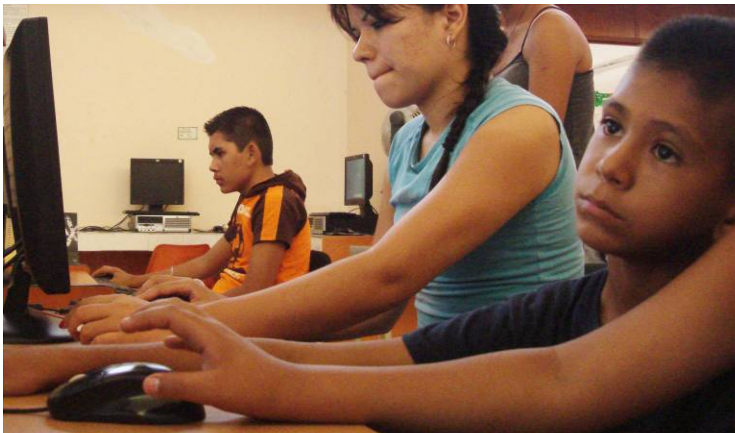
Jóvenes en espacio Cibernet de Poder Joven

Brindamos servicios de Cibernet y asesoría personalizada a jóvenes de todo el municipio