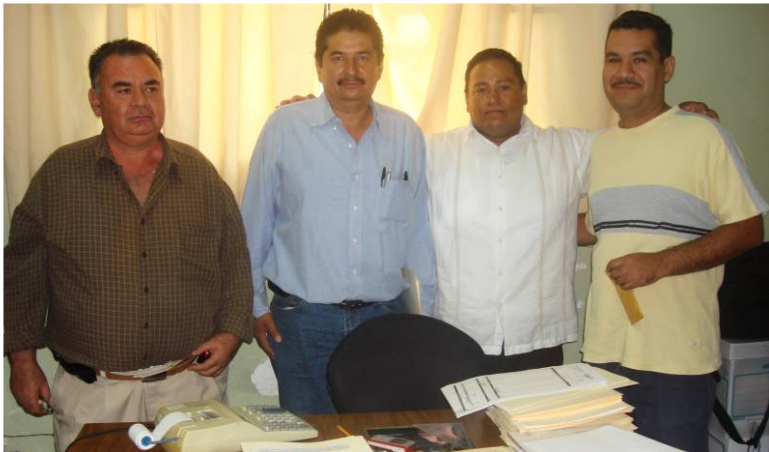
Entrega de apoyos del Programa Escuelas de Calidad