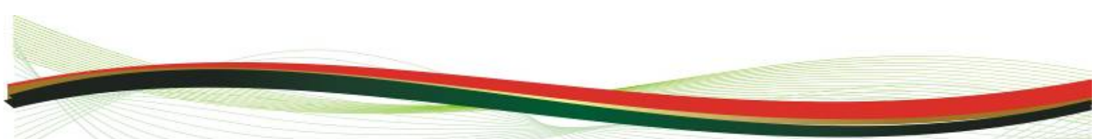
Foto Galería en el portal www.casimirocastillo.gob.mx/galeriadeinforme2010