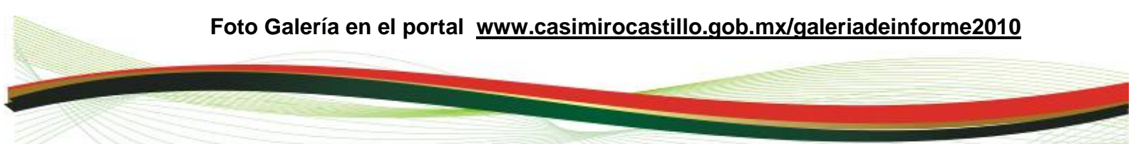
Foto Galería en el portal www.casimirocastillo.gob.mx/galeriadeinforme2010