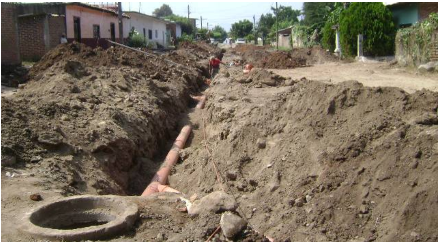
Calle González Gallo en la localidad de Piedra Pesada