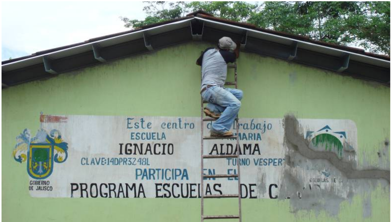
Rehabilitación de Escuela Primaria