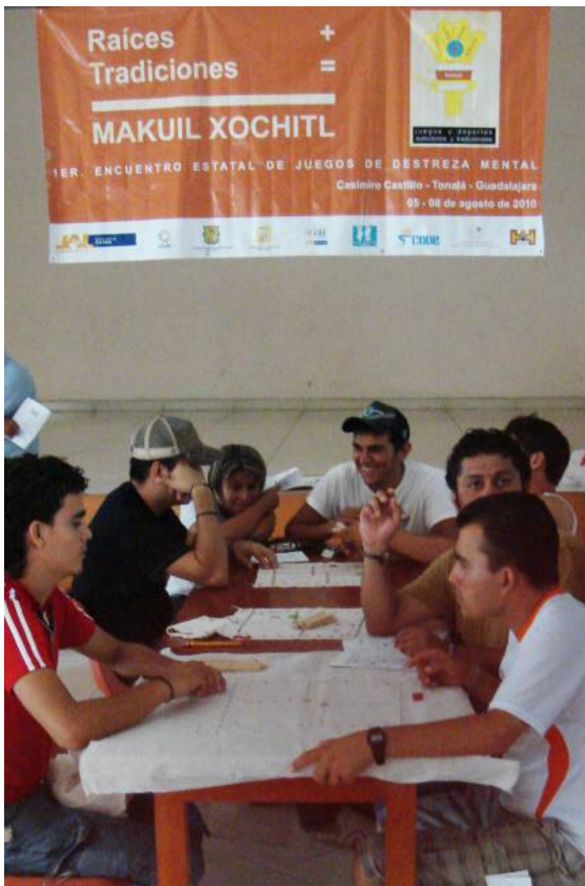
Juegos Indígenas "Kulich chanakua"