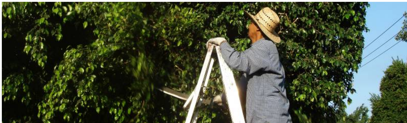
Poda de árboles

En el área de aseo público se ha brindado atención a espacios públicos e instituciones, así como planteles educativos, llevando a cabo las siguientes actividades: