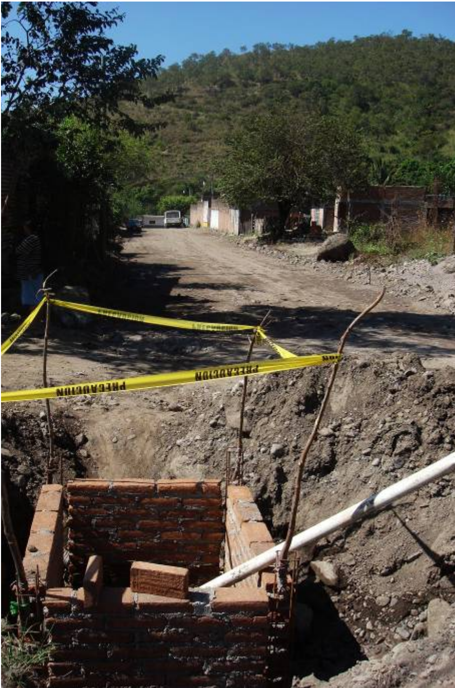
Calle 1ro. de Mayo de la localidad de La Resolana