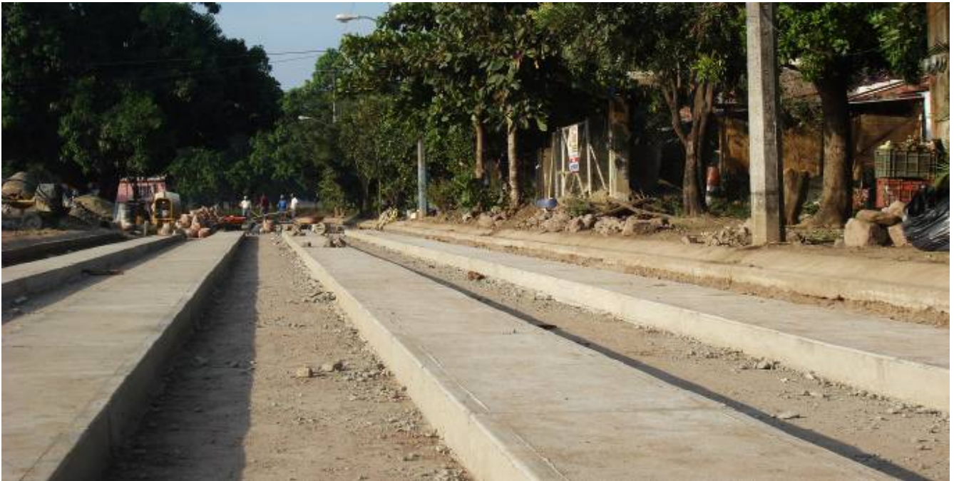
Construcción de empedrado ecológico de la calle Camino Real