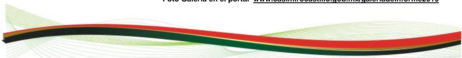
Foto Galería en el portal www.casimirocastillo.gob.mx/galeriadeinforme2010