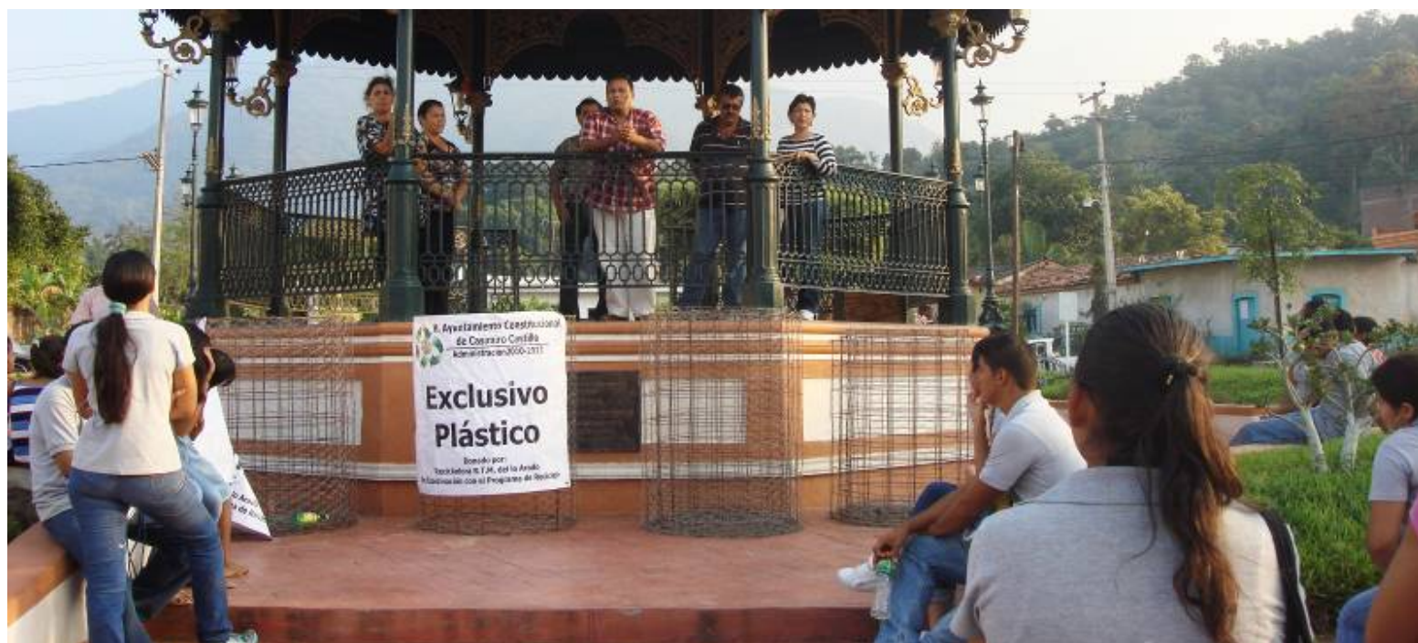
Entrega de contenedores para plástico en delegación de Los Tecomates del programa de Reciclaje

En el departamento de Reciclaje llevamos a cabo la capacitación sobre como reutilizar y clasificación de los derechos.