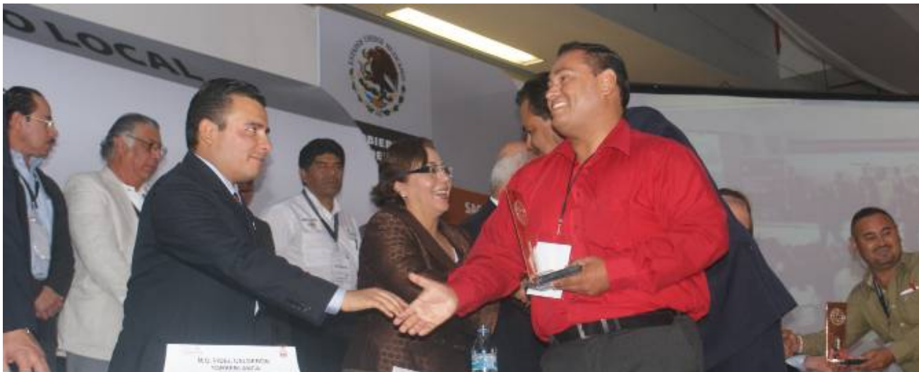
Entrega de reconocimiento de certificación de Agenda Desde lo Local 2010

La Agenda Desde lo Local es un programa desarrollado por la Secretaría de Gobernación (SEGOB) a través del Instituto Nacional para el Federalismo y el Desarrollo Municipal (INAFED) para impulsar el desarrollo integral de los municipios del país y crear condiciones de equidad entre todos los ciudadanos mexicanos.