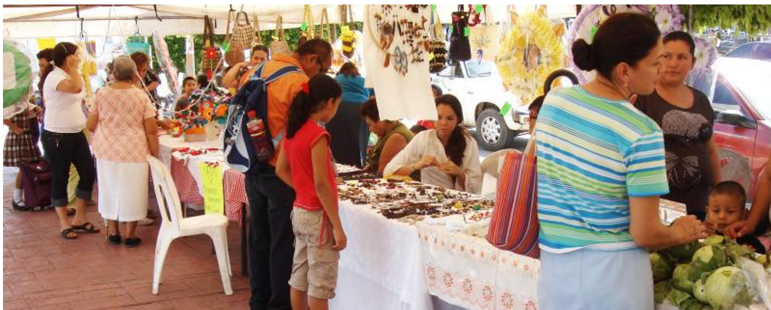
Festival Ambiental 2010 en el Jardín Municipal

Con una visión clara del desarrollo, hemos llevado acciones que inciden de manera integral en el sector rural de nuestro municipio, estas tareas han sido posibles gracias a la articulación del Consejo Municipal de Desarrollo Rural Sustentable, ya que es ahí donde se analiza la problemática y se consensan las acciones con los diferentes actores sociales que intervienen en el consejo, como es el caso de los comisariados ejidales, agentes y delegados municipales, representantes de organizaciones de productores, dependencias de gobierno y líderes de opinión.