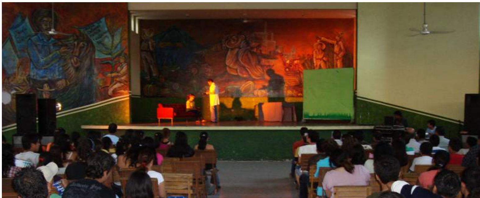
Obra de Teatro “El Estigma del Sida” en el Casino Cañero