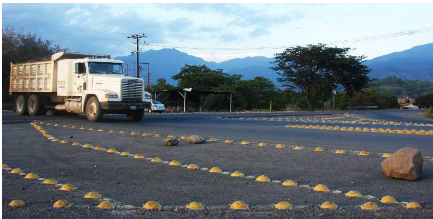
Carretera Federal 80, Autlan Casimiro Castillo