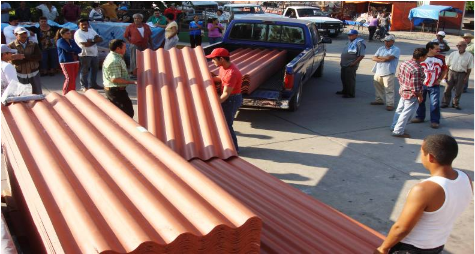
Entrega de láminas a beneficiarios

La Dirección de Promoción Económica Municipal en coordinación con la Congregación “Mariana Trinitaria” realizamos la entrega de apoyos con láminas dirigido a familias de escasos recursos: