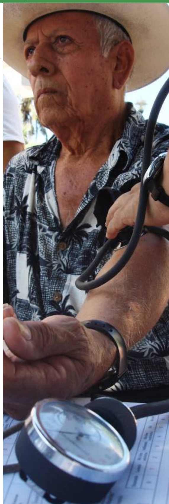
Atención Médica Municipal

www.casimirocastillo.gob.mx/galeriainforme2010