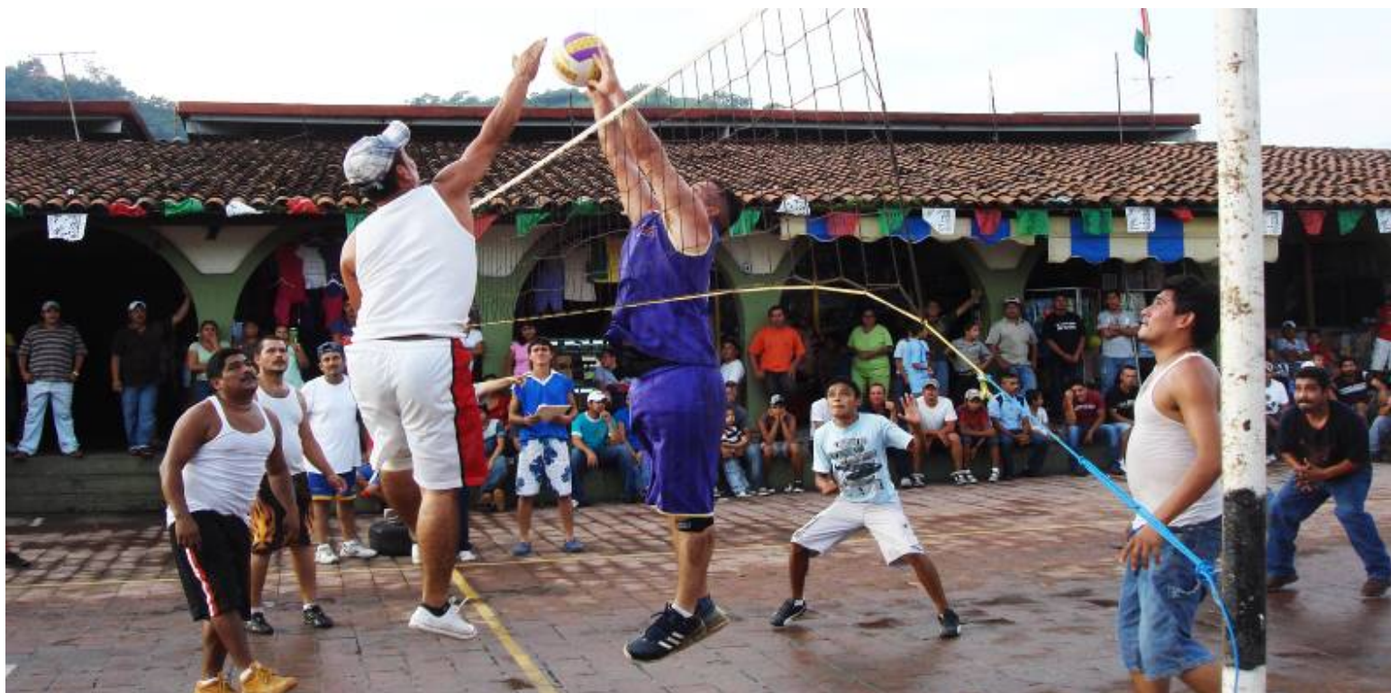
Torneo de Vóley bol

En la Dirección de Deportes hemos realizado la conformación del COMUDE “Comité Municipal de Deportes” con los titulares de los siguientes cargos: