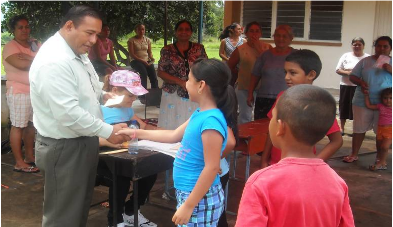
Entrega de Becas a niños beneficiados

Realizamos la entrega de apoyos en todo el municipio a niños de nivel primaria de escasos recursos, además de motivarlos por su dedicación y mantener buen promedio en sus calificaciones. El apoyo se hace cada cuatrimestre y consta de $400.00 pesos a cada beneficiario en beca económica y en despensa 4 cajas de productos básicos para su alimentación.