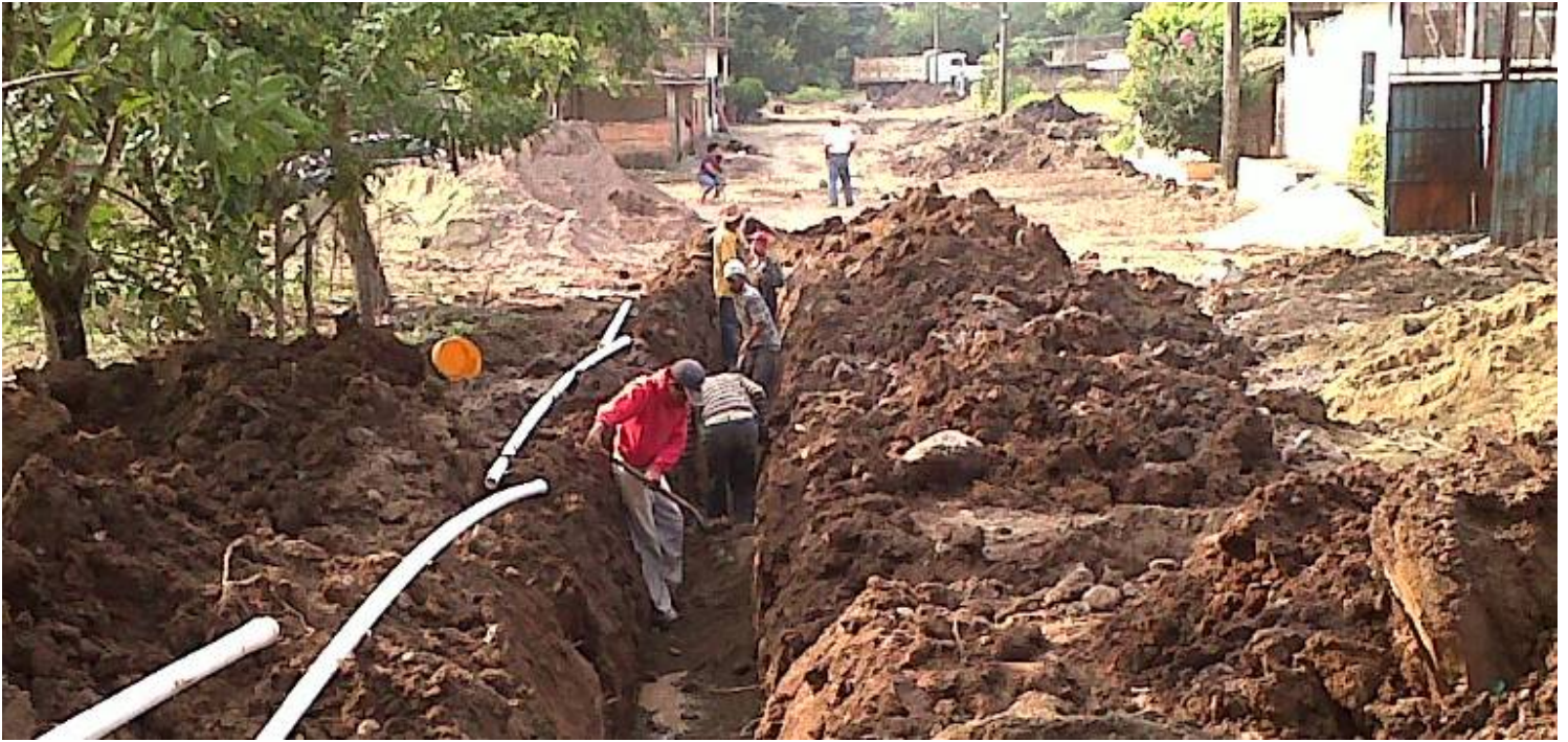
Calle Niños Héroes en la localidad de La Dotación