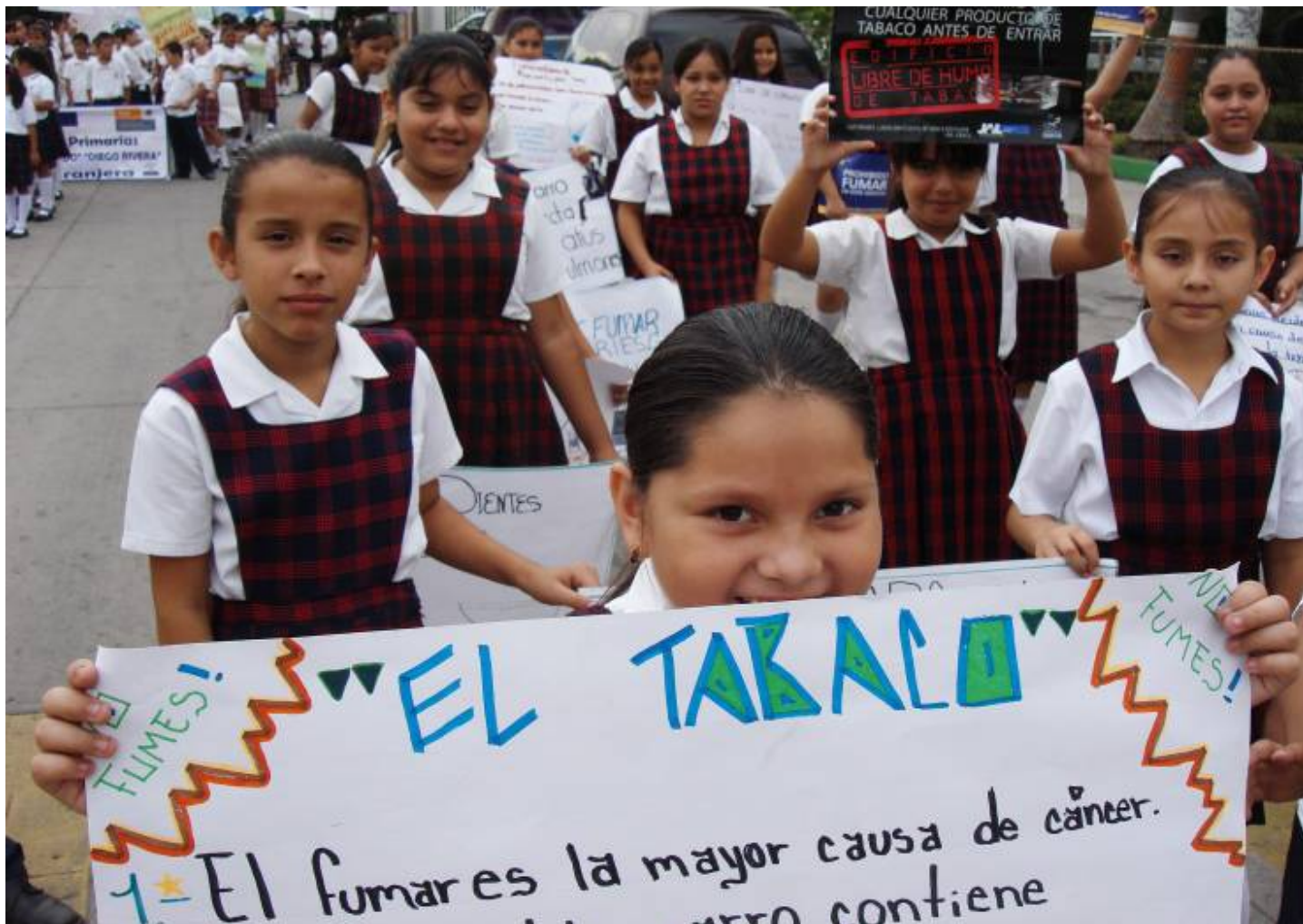
Desfile del Día libre del Humo del Tabaco

El Instituto Municipal de Atención a la juventud hemos realizado varios eventos juveniles en donde se realizaron algunas campañas de concientización en contra de las adicciones.