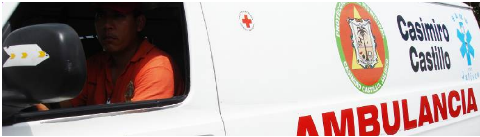
Ambulancia de Protección Civil Municipal

Llevamos a cabo la tarea de apoyar a las personas de escasos recursos con traslados a diferentes instituciones de Salud de la Región y el Estado de Jalisco.