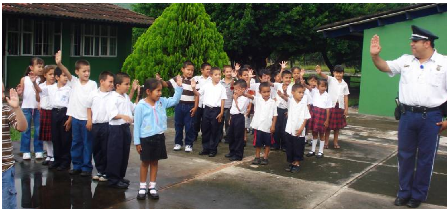
Actividades del Programa Educación Vial en preescolar

Llevamos a cabo la capacitación sobre Educación Vial con los elementos de vialidad municipal en las escuelas de nivel Primaria y Preescolar de la cabecera municipal y delegaciones, impartiendo los conocimientos básicos sobre los derechos y obligaciones de peatones y conductores de vehículos. Impartiendo los cursos al siguiente número de escuelas: