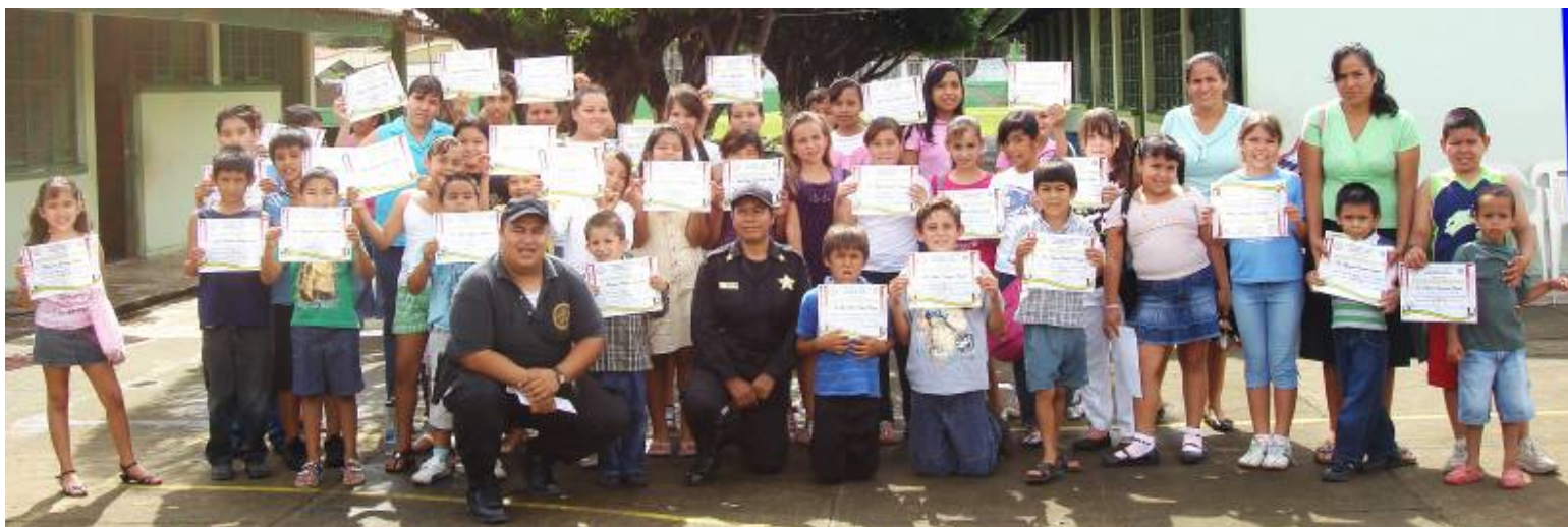
Fin de curso de prevención del delito a niños y padres de familia