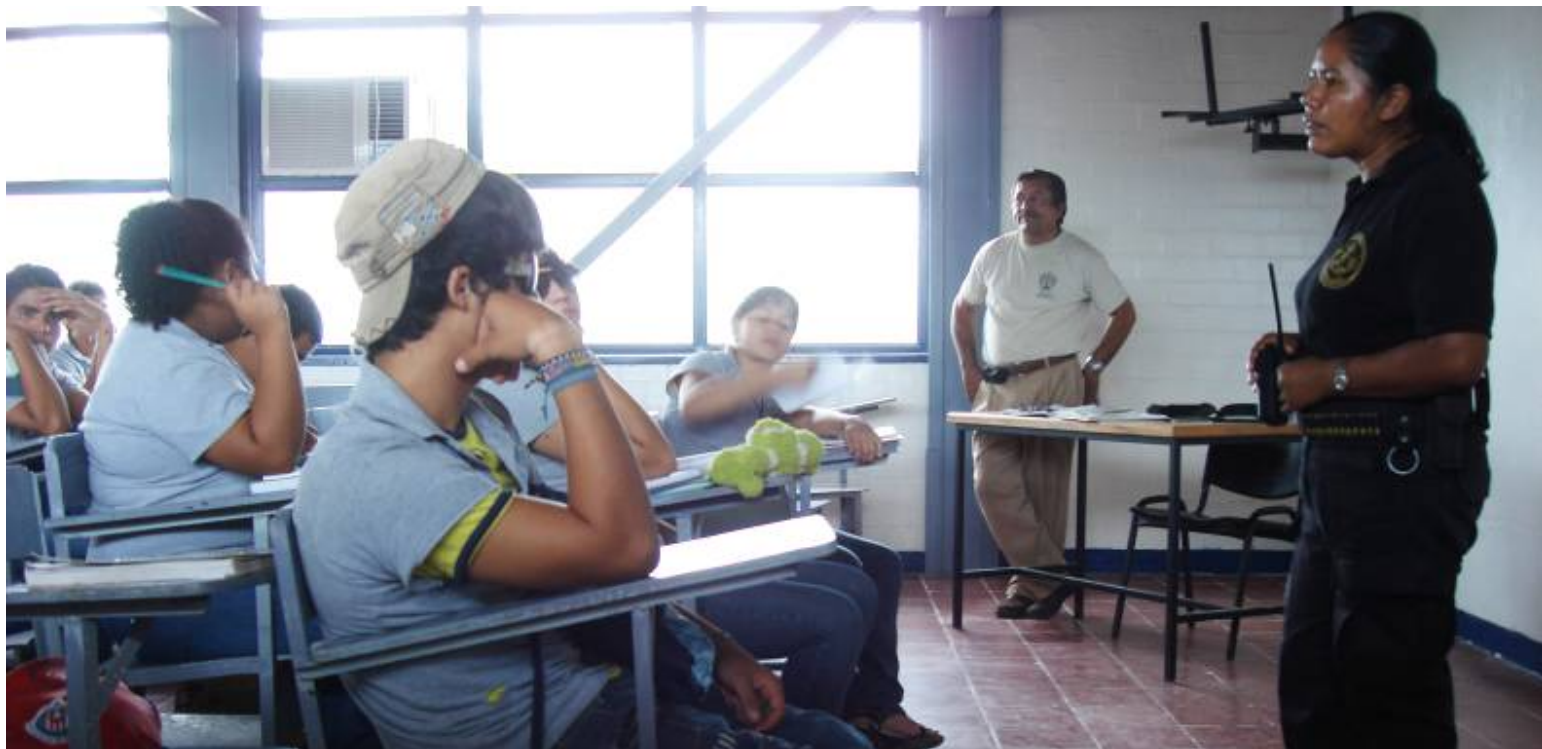
Capacitación a alumnos de bachillerato

Llevamos a cabo la campaña de “Prevención del Delito” en diferentes escuelas del municipio, a través del Oficial DARE de la Dirección de Seguridad Pública Municipal, dando a conocer los siguientes temas: