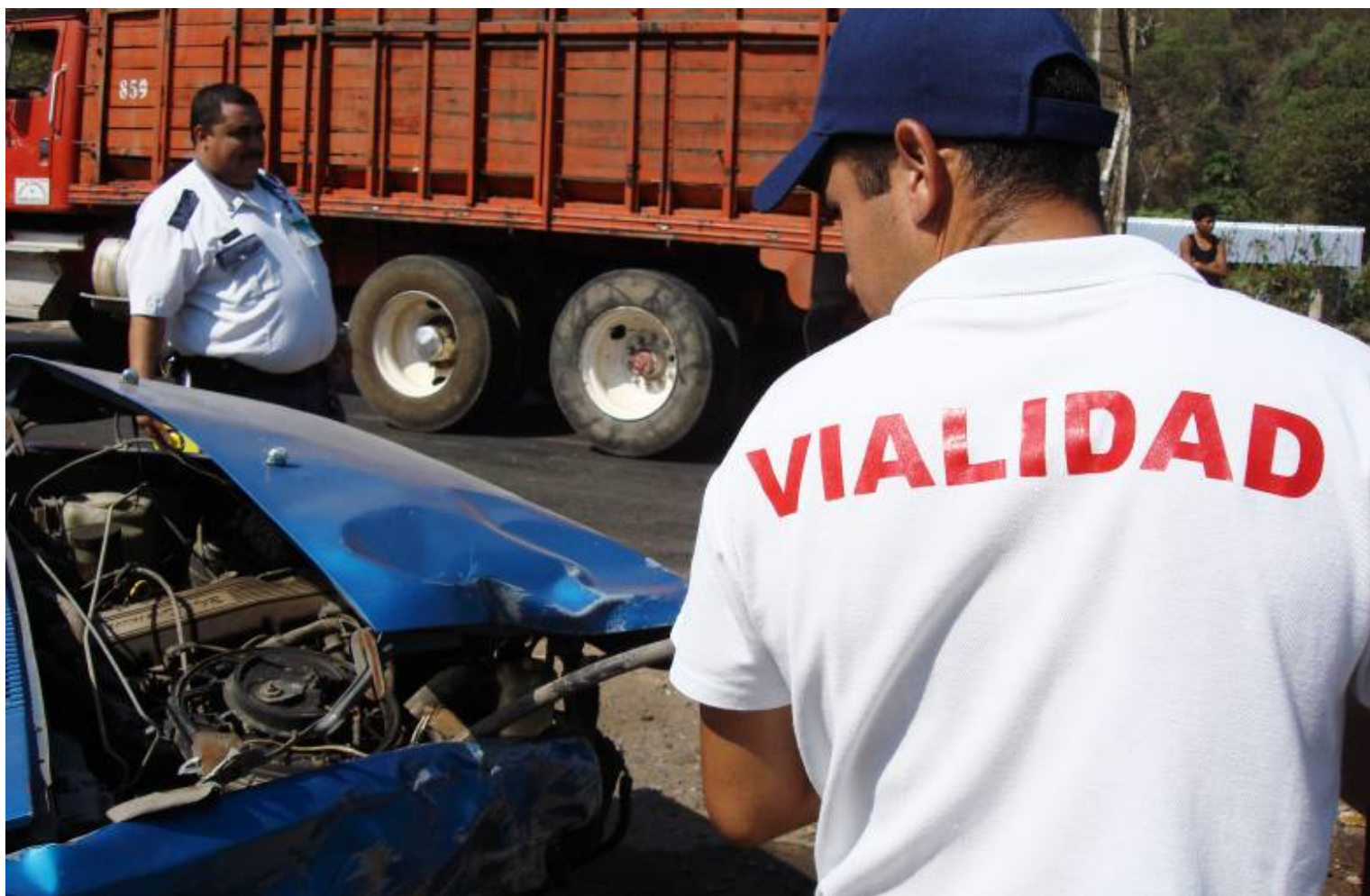
Servicio de Vialidad Municipal

Llevamos a cabo diferentes actividades que cumplen con el objetivo de mejorar día con día la educación vial en nuestro municipio.