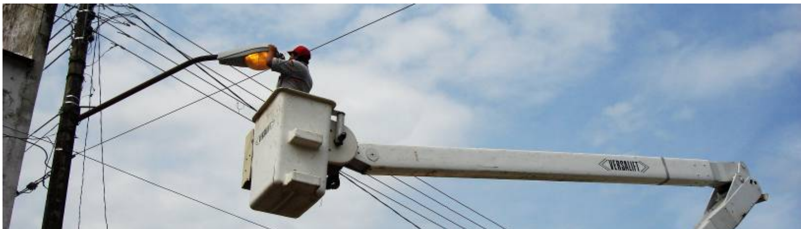
Instalación de lámpara para alumbrado público

En el Departamento de Alumbrado Público hemos llevado a cabo los siguientes servicios en las delegaciones y agencias de todo el municipio.