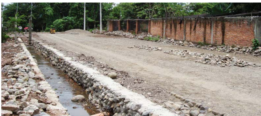
Mamposteo en calle Leobardo García en la localidad de Benito Juárez