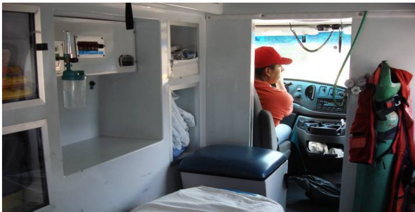
Ambulancia de Protección Civil Municipal

En el Departamento de Protección Civil Municipal hemos trabajado de manera comprometida al servicio de la ciudadanía atendiendo cada uno de los reportes que se presentan, cumpliendo así con nuestra función de brindar ayuda a quienes lo necesitan.