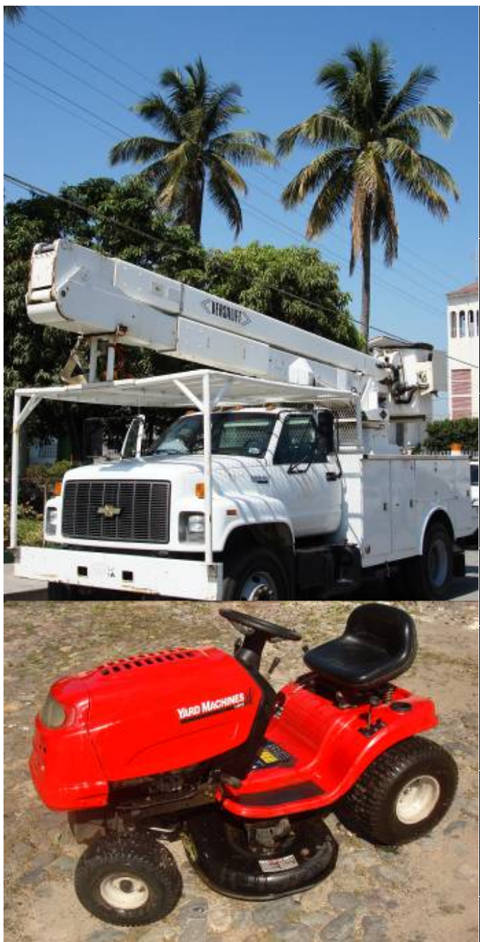
Grúa para alumbrado público y tractor podador