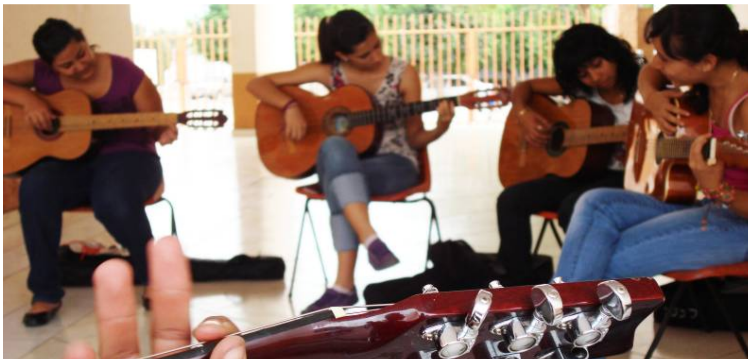
Taller de guitarra en Casa de la Cultura

En el primer año de la administración trabajamos para fomentar la Cultura en nuestro municipio, llevando a cabo diferentes actividades; talleres y eventos culturales en fechas conmemorativas.