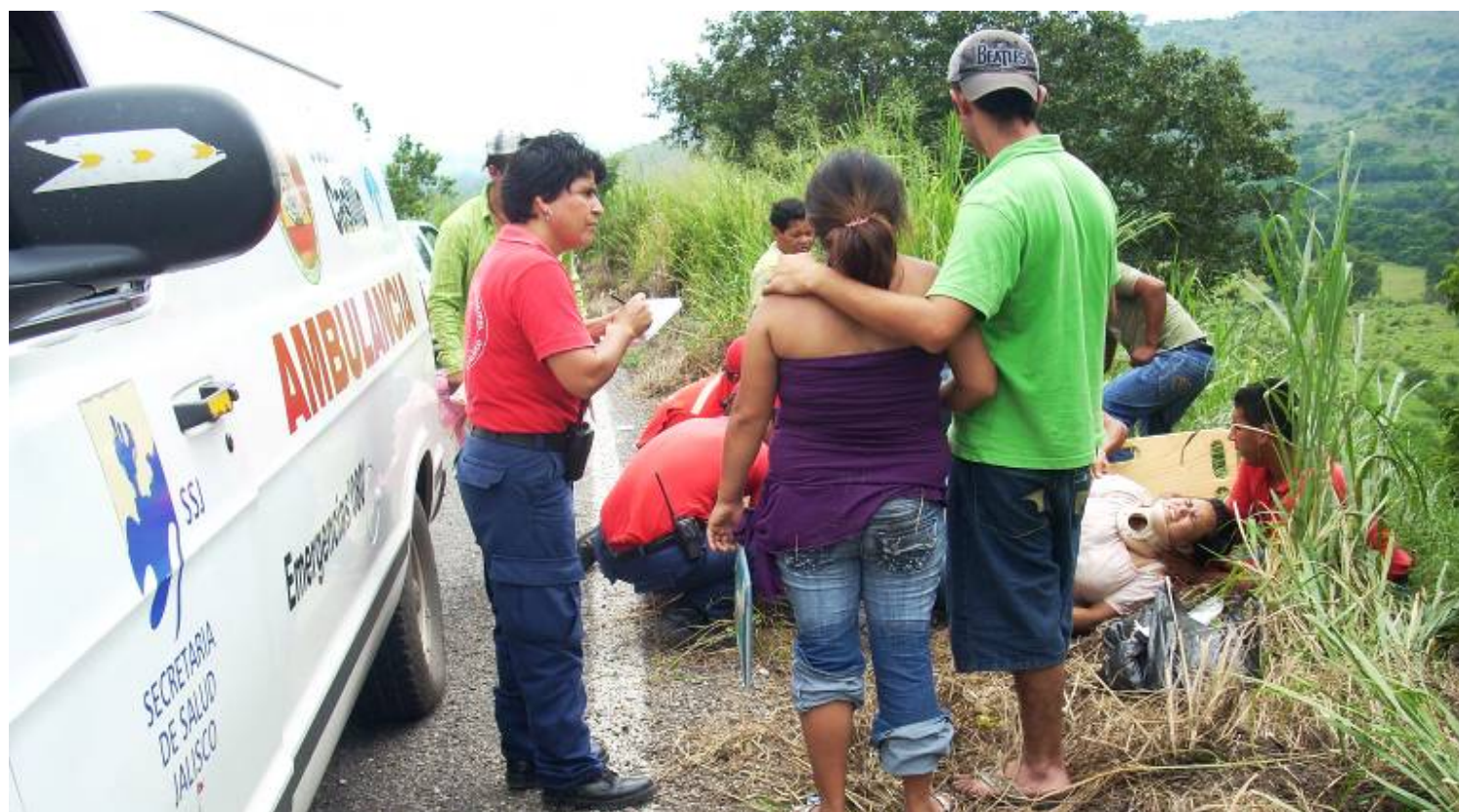
Servicio de Protección Civil a ciudadanos

Llevamos a cabo diferentes campañas de prevención de accidentes y/o medidas de prevención en caso de desastres naturales: