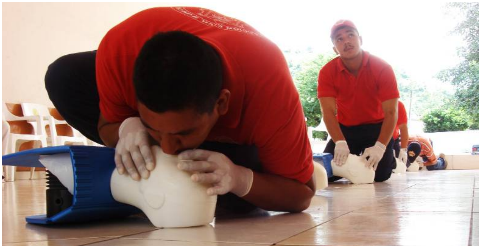
Capacitación a personal de Protección Civil