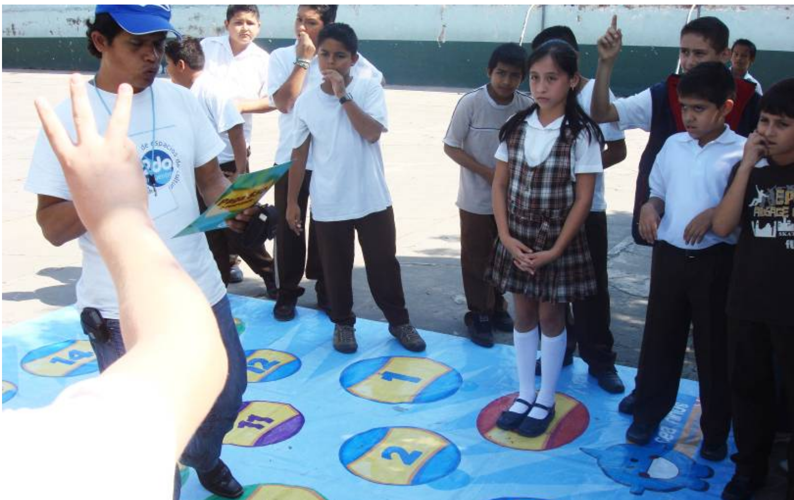
Capacitación de ECA en escuela

Llevamos a cabo las diferentes actividades en coordinación con las Dependencias del Gobierno del Estado para la campaña de concientización sobre el cuidado del agua, en la que logramos la participación de escuelas del municipio y diferentes grupos de la ciudadanía.