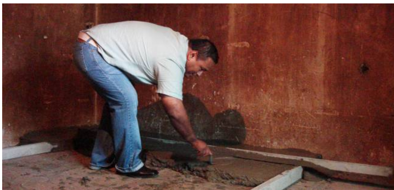
Construcción de Piso Firme