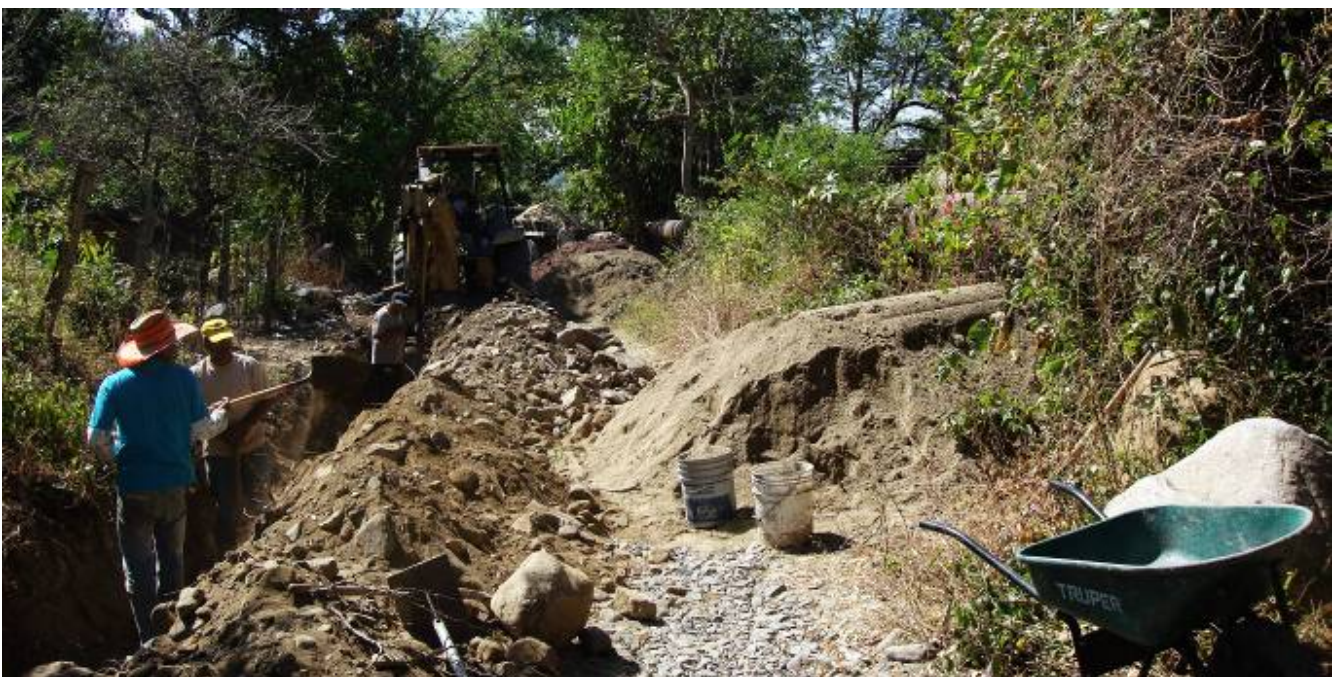
Callejón del Tubo de la localidad de La Resolana