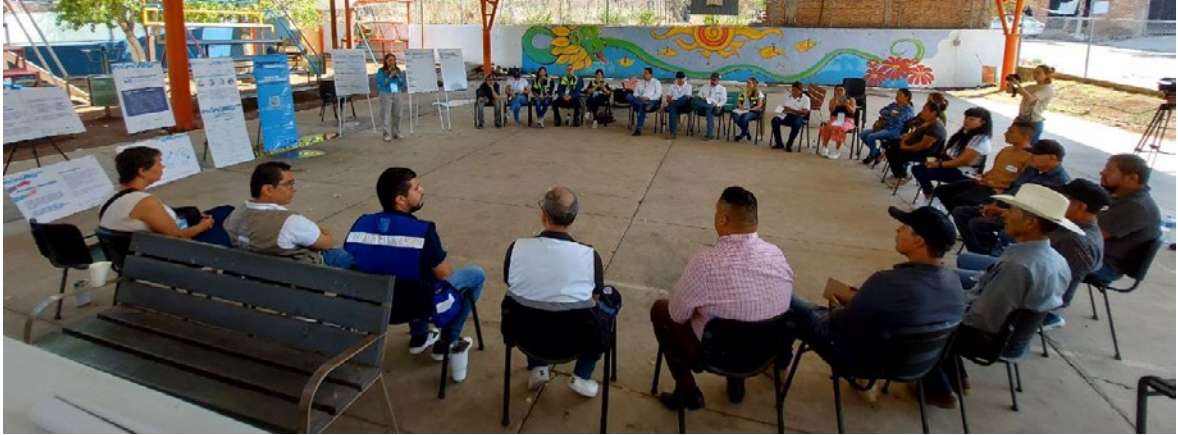
Imagen 2. Asamblea Popular, introducción