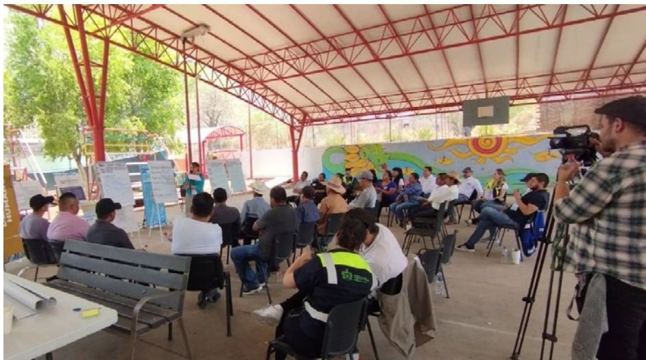
Imagen 7. Asamblea Popular