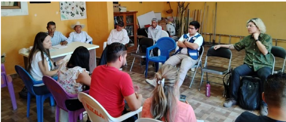
Imagen N°1: Reunión con autoridades indígenas de Mezcala, 17 de abril de 2024

En un principio se hizo un acercamiento con las autoridades indígenas de la comunidad de Mezcala, para coordinar los aspectos esenciales de la Asamblea y una exposición del proceso de concertación; dentro de los compromisos se acordó que dichas autoridades realizaran la convocatoria para la Asamblea Popular.