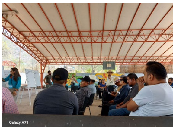
Imagen 3 y 4. Asamblea Popular

Entre otras enfermedades señaladas, se mencionó la diabetes y alarma por muchos casos de hepatitis en las escuelas. Demandan servicios de nutrición para equilibrio de la alimentación, especialmente para pacientes diagnosticados con insuficiencia renal.