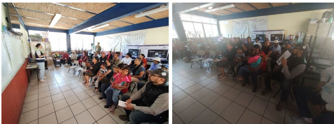
Imagen 9 y 10. Asamblea Popular, mesa de Medidas de Mitigación

Dentro de las acciones que tendrían que implementarse, según las personas participantes, para mitigar las problemáticas señaladas está la utilización de insumos y fertilizantes orgánicos que sustituyan los agroquímicos. También se proponen más sanciones y multas para quienes tiren y queman basura. Siendo la laguna una fuente de alimento de las comunidades se solicita que se comparta la información sobre las investigaciones y estudios de calidad del agua.; así como información necesaria sobre los estudios realizados acerca de los peces de la laguna.