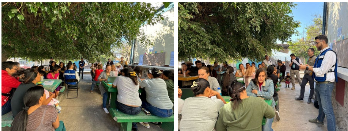
Imagen 2 y 3. Asamblea Popular, mesa de Bienestar Comunitario y Ciudadanía Saludable

Se reconoce el trabajo que se está realizando en cuanto a la atención a las personas con enfermedades renales; las cuestiones de tamizaje ha sido importante para la población . También se reconoce el esfuerzo por generar espacios dignos para la comunidad como canchas deportivas y calles en mejor estado.