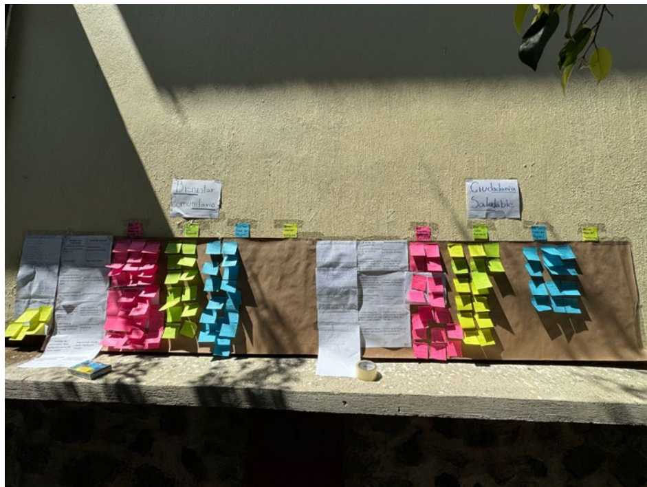
Imagen 4. Asamblea Popular, papelógrafo de mesa de Bienestar Comunitario y Ciudadanía Saludable