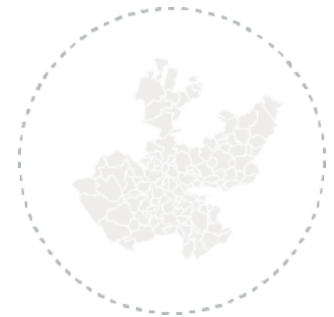
Por área metropolitana de Jalisco